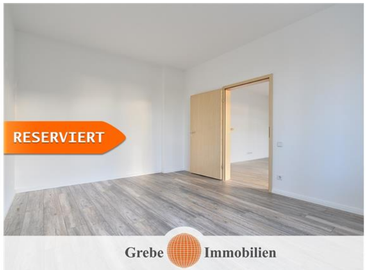
Schlafzimmer Bild 2