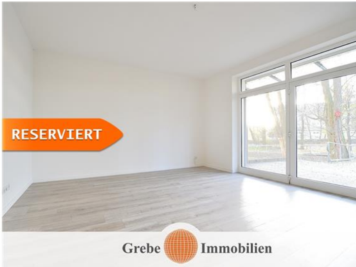
Wohnzimmer mit Grünblick