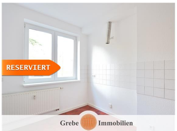
Küche mit Dunstabzug