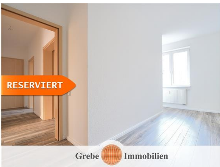
Flur / Arbeitszimmer